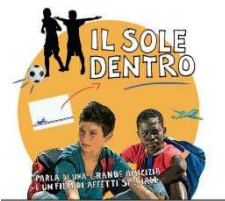
Il Sole Dentro

Mercoledì 23 giugno ore 21.30 Giovani, creatività e periferie del mondo Restituzione del progetto Ragazzi in città 2 con la proiezione de Il sole dentro di Paolo Bianchini (2011, 107'). Ingresso libero